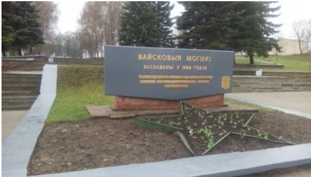
Воинское кладбище по ул. Белуша