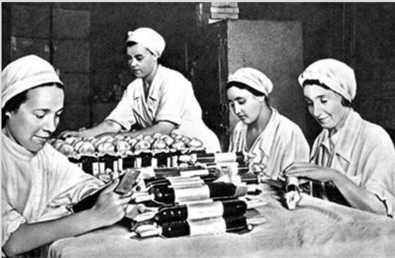
Подготовка ампул с кровью для отправки на фронт (1942 г.)