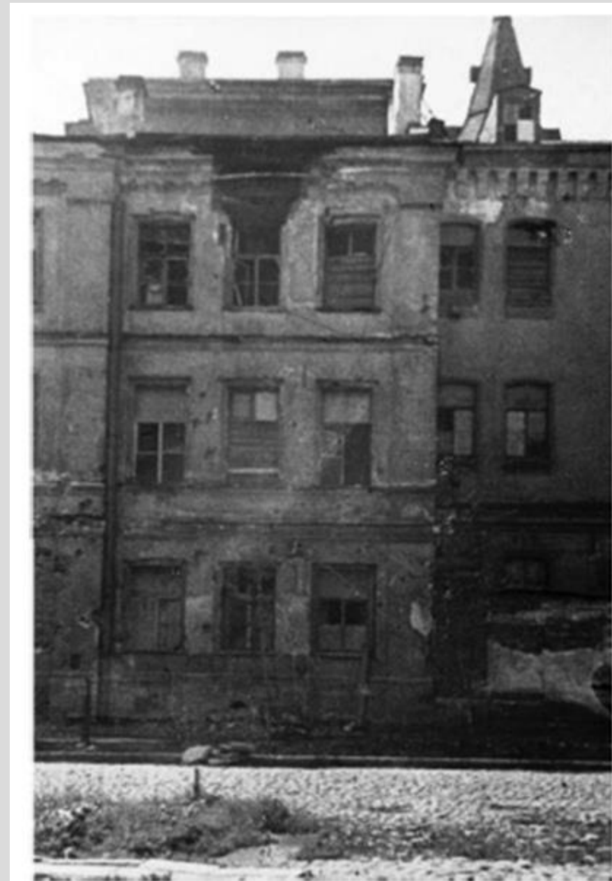
Здание ЛИПК после артиллерийского обстрела в июле 1943 года.