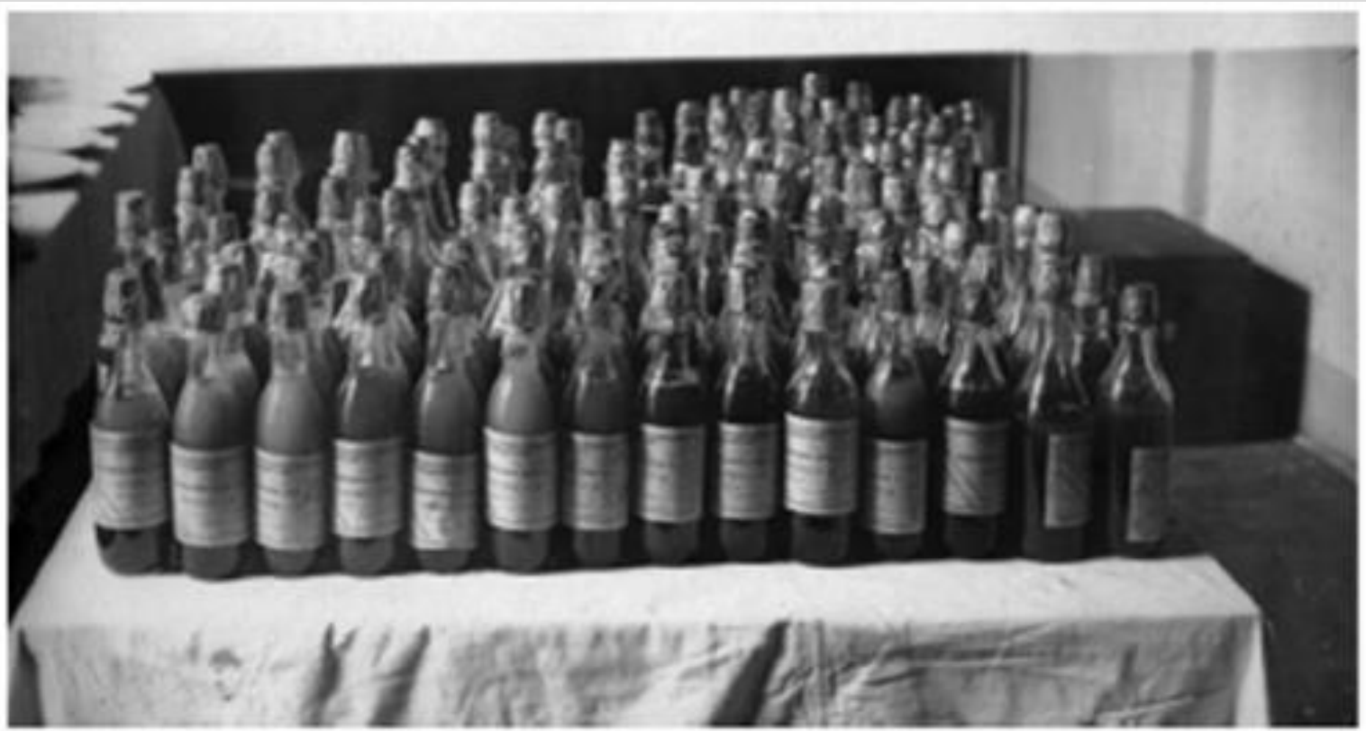
Консервированная кровь, заготовленная в ЛИПКе для отправки на фронт.