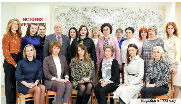
Кафедра в 2023 году

Основные перспективы своего развития кафедра видит в совершенствовании педагогического мастерства и развитии научного потенциала сотрудников; расширении спектра предоставляемых образовательных услуг в рамках специализации кафедры; дальнейшем развитии потенциала студентов за счет совершенствования иноязычной и терминологической компетенции; расширении связей с многочисленными партнерами в лице аналогичных кафедр как в своей стране, так и за ее пределами; укреплении и развитии материально-технической базы.