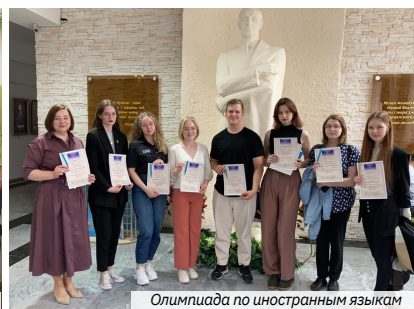
Олимпиада по иностранным языкам