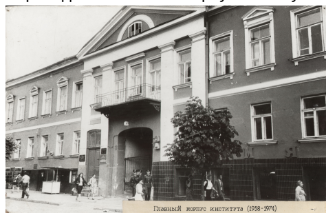
Главный корпус института (1958-1974)

Кафедра иностранных языков всегда была центром изучения иностранных языков для разных категорий обучающихся. Помимо студентов, в 1990-е годы на кафедре стали изучать иностранные языки и клинические ординаторы (в то время спецординаторы). Первая база кафедры размещалась в административном здании по улице Ожешко, 1. В 1962-1963 учебном году кафедра иностранных языков «переехала» в биологический корпус на ул. Виленская. В 1974 году она была переведена в главный корпус института по ул. Горького, 80, где располагается сейчас.