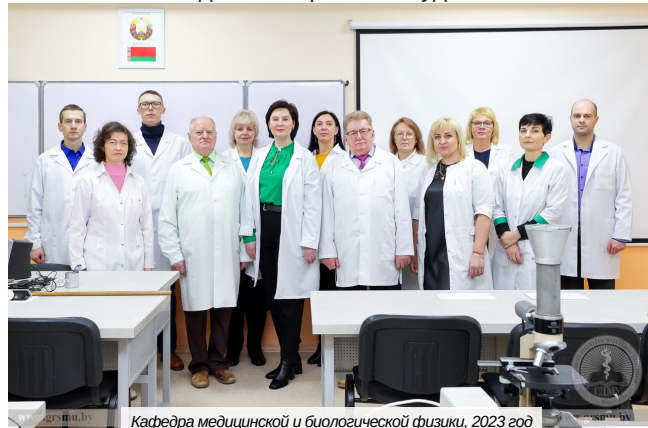
Кафедра медицинской и биологической физики, 2023 год

В новом веке с развитием научно-технического прогресса возрастает количество учебных дисциплин, преподаваемых кафедрой. Помимо дисциплины «Медицинская и биологическая физика» были введены и новые: «Медицинская техника» для специальности «Сестринское дело», «Основы информационных технологий» (с 1999 года) для аспирантов и соискателей, «Информатика в медицине» и «Основы энергосбережения» (с 2008 года), «Основы статистики» (с 2014 года). Педагогический штат кафедры, помимо физиков, дополнили математики. На кафедре начинается преподавание на английском языке для иностранных студентов ФИУ, а вскоре и для слушателей подготовительного отделения.