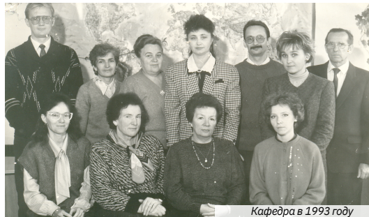
Кафедра в 1993 году

Кафедра иностранных языков является одной из первых кафедр Гродненского медицинского института, основанной в соответствии со штатным расписанием, утвержденным Министром здравоохранения БССР от 9 сентября 1958 года.