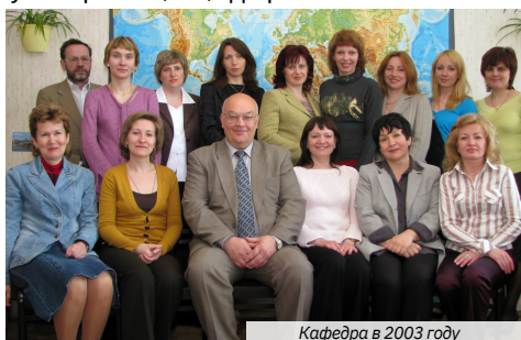
Кафедра в 2003 году