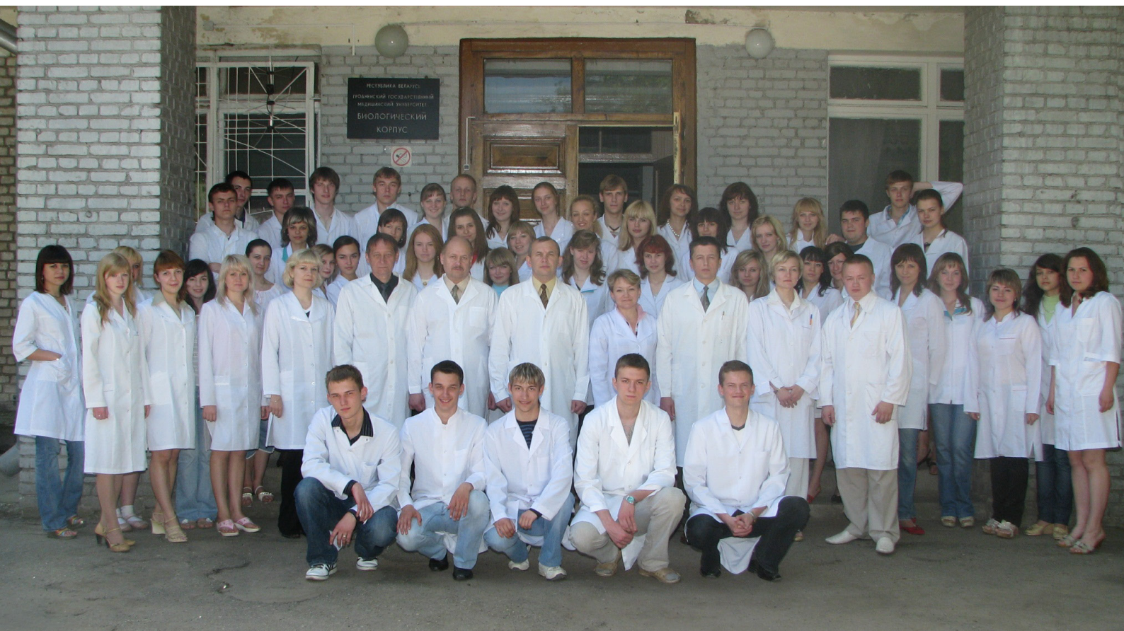
Кафедра нормальной физиологии (2009)

– Первая диссертация под моим руководством была выполнена и защищена в 2001 году. 2004 год для меня был особенным, под моим руководством в тот год было защищено 4 кандидатские диссертации. Работа с аспирантами, соискателями в чём-то интересная, но и достаточно сложная и непредсказуемая.